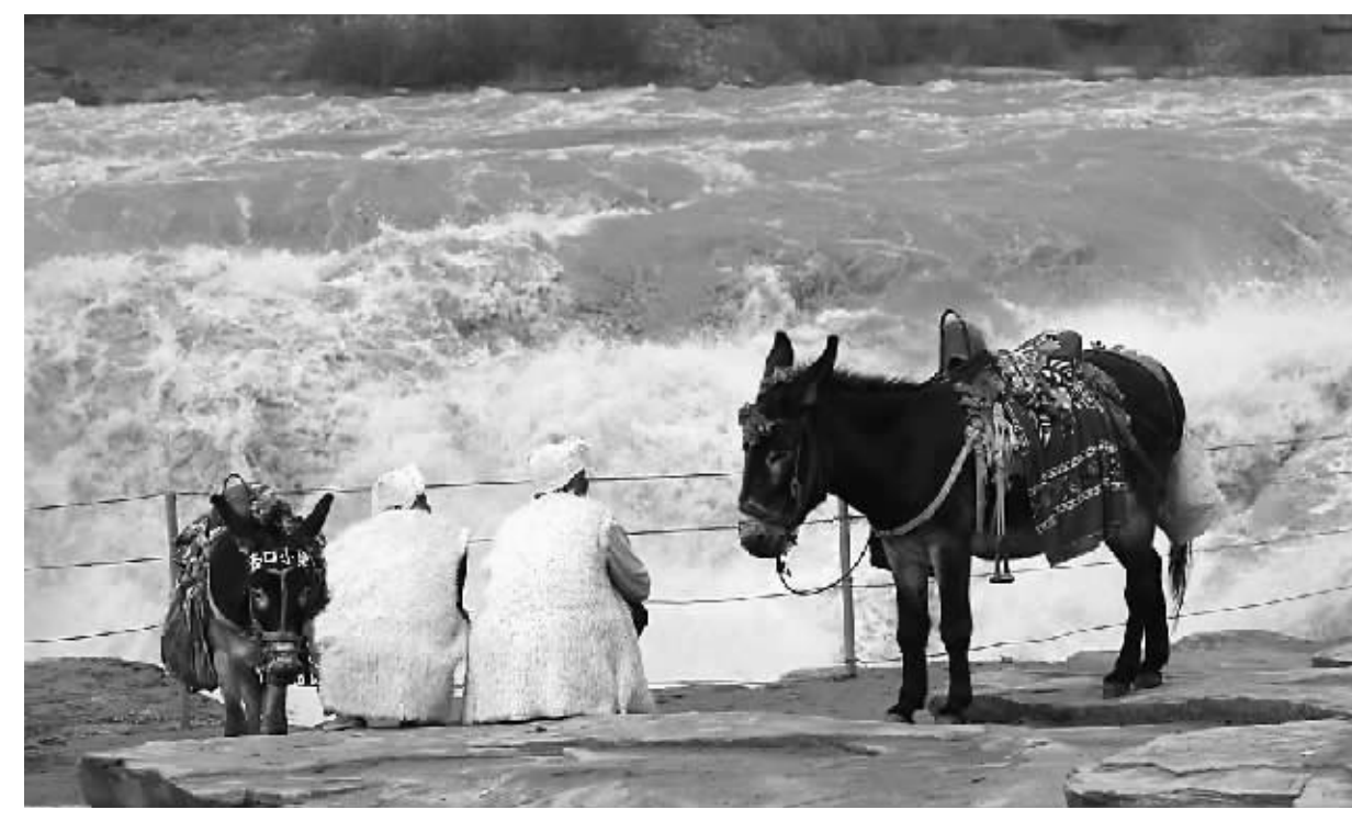
黄河岸边

境和心灵感受,冷清、寂寥、无奈,这样的意象象征了诗人在现实生活当中的遭遇和心境。“高处不胜寒”,作者采用了象征的手法,把嫦娥的幽清寂寞和她丰富的内心活动生动形象地刻画了出来,同时营造了悠远深邃、情韵绵长的意境。 到了宋代,我们又进入了词的盛世。由于创作队伍的不断壮大,创作视野的不断开阔,创作技巧的不断嬗变,这一时期的词坛气象万千,叫人叹为观止。而在中秋诵月的词作中,苏轼的《水调歌头》最为脍炙人口。“明月几时有?把酒问青天。不知天上宫阙,今夕是何年。我欲乘风归去,又恐琼楼玉宇,高处不胜寒。起舞弄清影,何似在人间!转朱阁,低绮户,照无眠。不应有恨,何事长向别时圆?人有悲欢离合,月有阴晴圆缺,此事古难全。但愿人长久,千里共婵娟。”苏轼在对明月的追问和对兄弟的怀念中,完成了一次关于宇宙、时空和人类共同情感的激情宣泄与心灵超越。词人起于月又归于月,构思巧妙而又跌宕起伏,意境深远却又浑然一体。“但愿人长久,千里共婵娟”,这是中秋月夜多么美好的祝福与牵挂!《苕溪渔隐丛话》中对《水调歌头》一词给予了高度评价,说:“中秋词,自东坡《水调歌头》一出,余词尽废”,这并非溢美之词。 唐宋元明清以来,中秋节逐渐成为中华民族重要的传统佳节。如今的中国明月更多地蕴涵了中国人追求祖国统一、家庭团聚、分享亲情、和谐共处的美好理想。